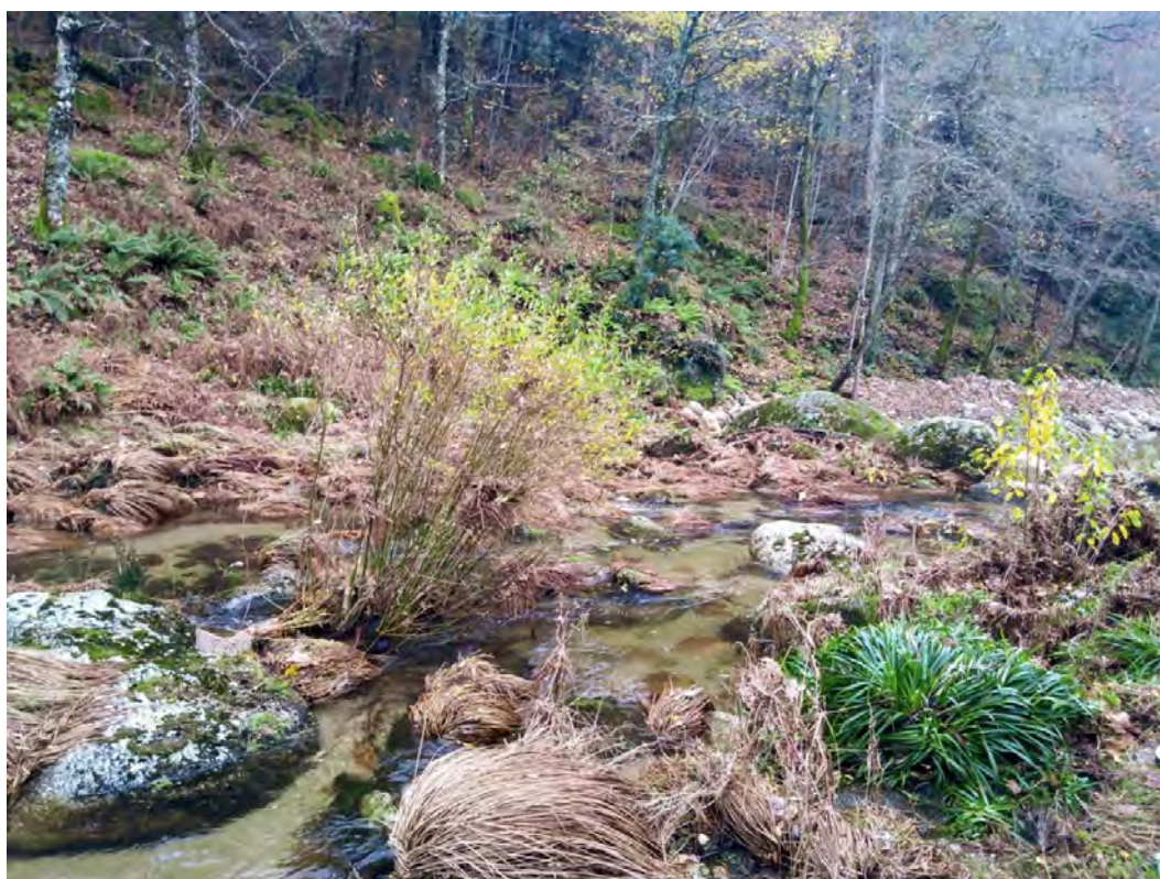
Imagem e palavras do João Cardoso

A imagem mostra um lugar aberto, ao ar livre e com bastante luminosidade. O terreno apresentado na imagem é inclinado. Ao longo dele estende-se uma vasta vegetação até ao rio.