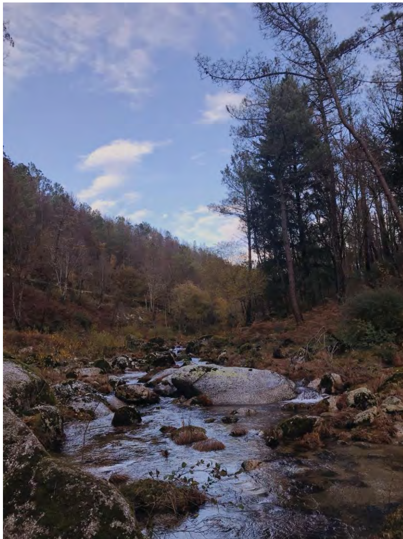
Imagem e palavras da Jéssica Oliveira

A imagem insere-se na natureza rural. Foi captada a partir da margem de um rio e conseguimos observar diversos elementos.