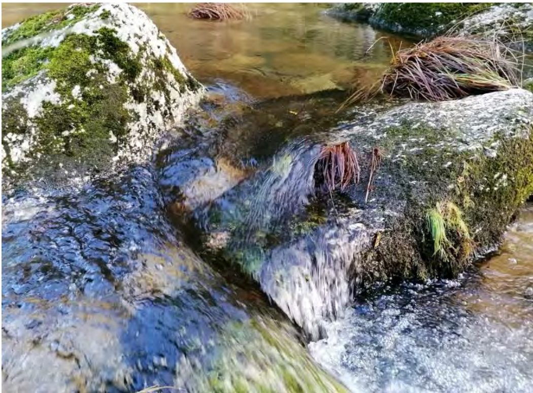
Imagem e palavras do João Pais

Nesta imagem, podemos observar uma fração de um rio que corre ao longo de quilómetros, atravessando pedras e escorrendo através do musgo que nelas existe. É um local calmo onde tudo ocorre naturalmente e a Natureza reina.